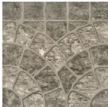
Art. Gris Med.: 36 x 36