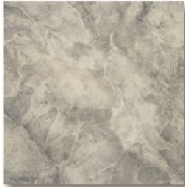
Art. Suquía Med.: 36 x 36