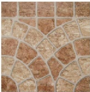
Art. Marrón Med.: 36 x 36