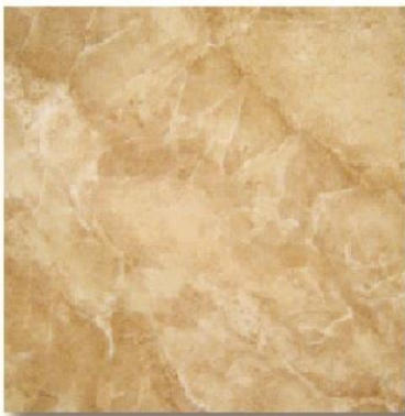
Art. San Antonio Med.: 36 x 36