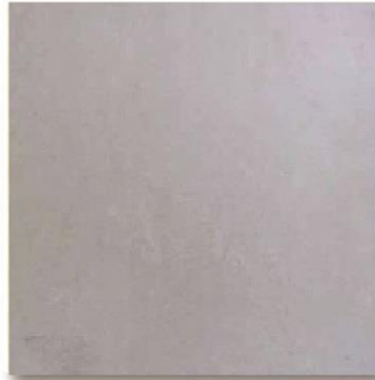
Art. Champaquí Med.: 36 x 36